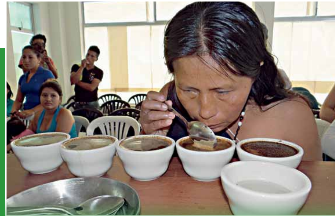
• El intercambio de experiencias entre los participantes es básico para conseguir un mejor producto.