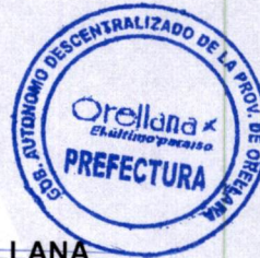
Abg. Guadalupe Llori Abarca PREFECTA DE LA PROVINCIA DE ORELLANA

CERTIFICACIÓN.- Siento como tal que la Abg. Guadalupe Llori Abarca Prefecta de la Provincia de Orellana, sancionó y ordenó la publicación de la Ordenanza que antecede el 24 de julio del 2018.